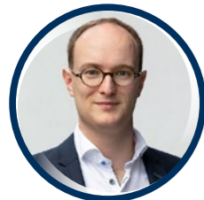
Paul Helm BWE

Hier erfahren sie alles zum Schutz von Fledermäusen in Deutschland und deren Gefährdung durch Windenergieanlagen. Fledermäuse sind besonders schützenswerte Arten, die durch Lebensraumverlust und Klimawandel bedroht sind. Windenergieanlagen stellen durch Kollisionen und Druckunterschiede eine zusätzliche Gefahr dar. Der BWE setzt sich für Maßnahmen wie Betriebsbeschränkungen und Monitoring ein, um Fledermäuse zu schützen und gleichzeitig den Ausbau der Windenergie voranzutreiben.